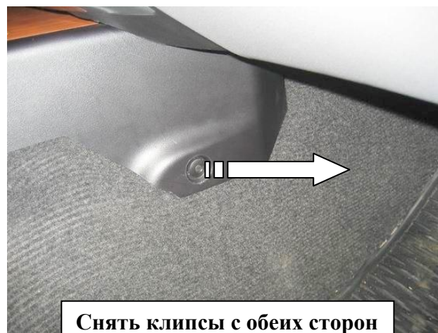
Снять клипсы с обеих сторон