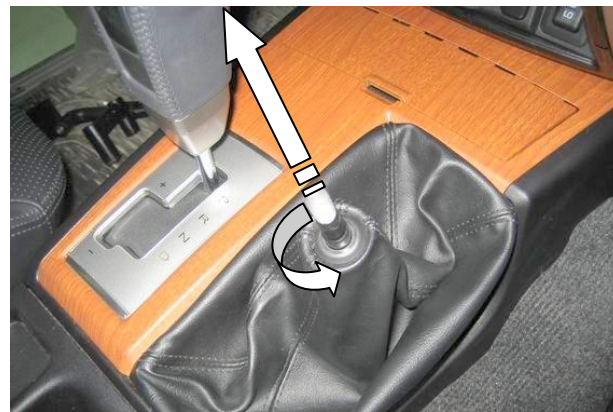
Открутить и снять рукоятку раздатки