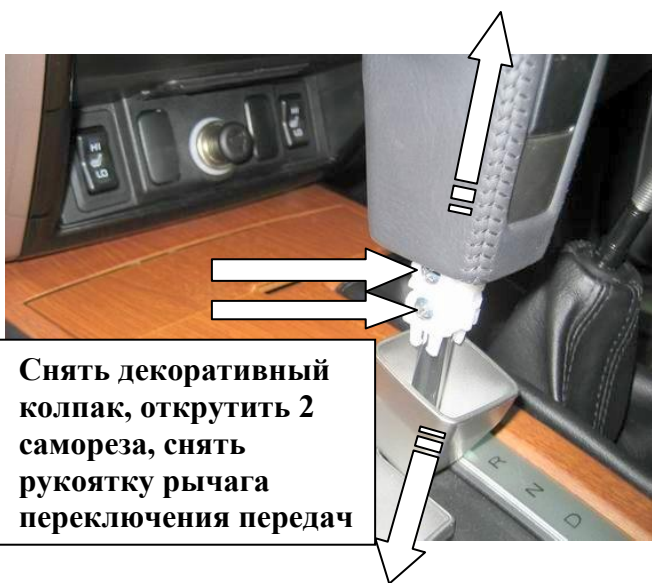
Снять декоративный колпак, открутить 2 самореза, снять рукоятку рычага переключения передач