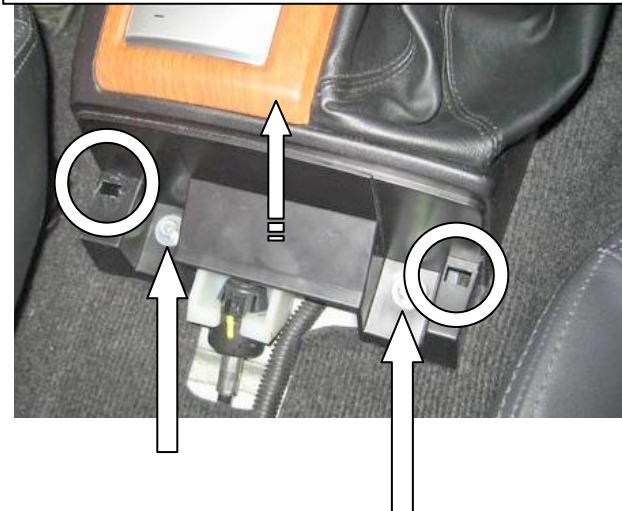
Открутить 2 болта, разомкнуть клипсы (осторожно!!!), снять переднюю консоль