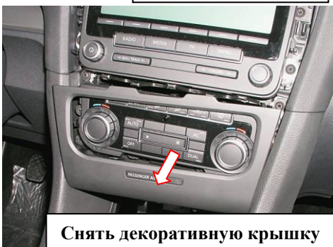
Снять декоративную крышку