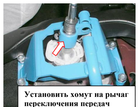
Установить хомут на рычаг переключения передач