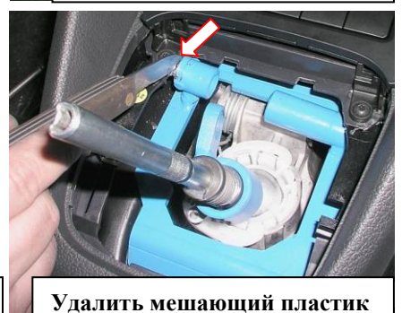
Удалить мешающий пластик