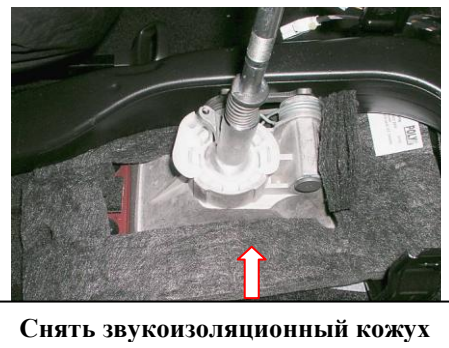
Снять звукоизоляционный кожух