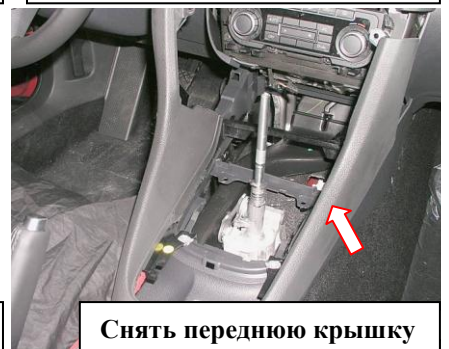
Снять переднюю крышку