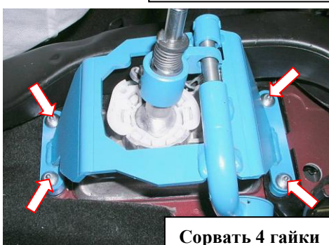
Сорвать 4 гайки