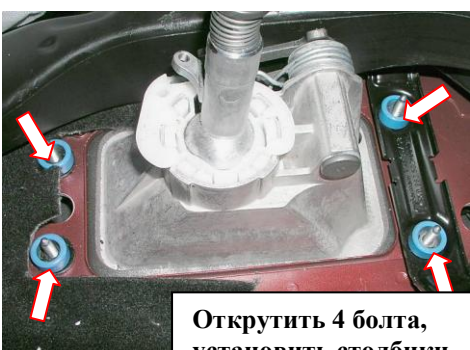
Открутить 4 болта, установить столбики