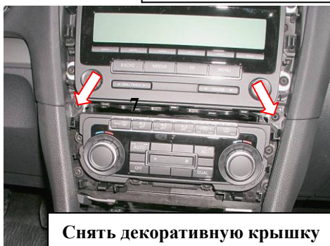
Снять декоративную крышку