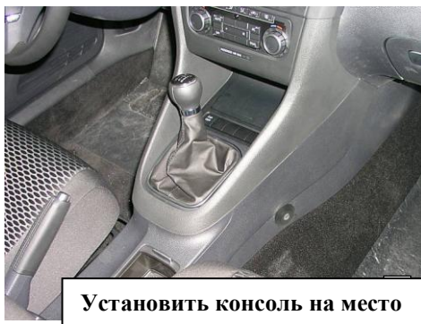
Установить консоль на место