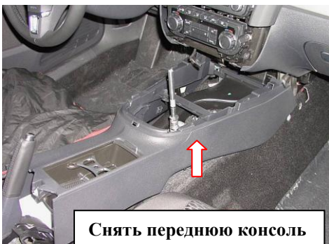
Снять переднюю консоль