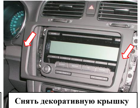
Снять декоративную крышку