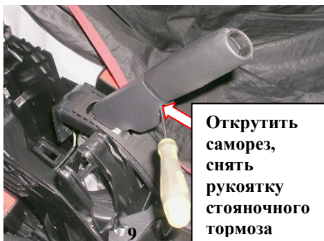
Открутить саморез, снять рукоятку стояночного тормоза