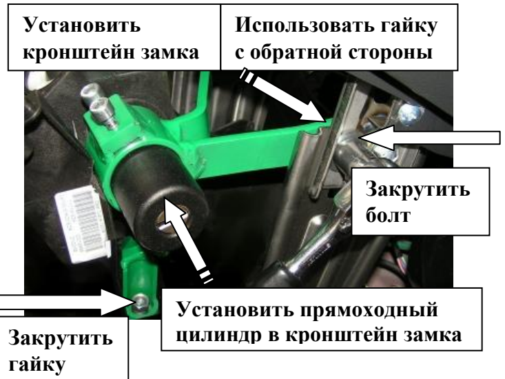
Установить кронштейн замка