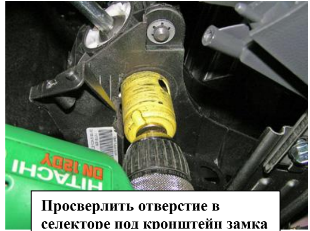
Просверлить отверстие в селекторе под кронштейн замка